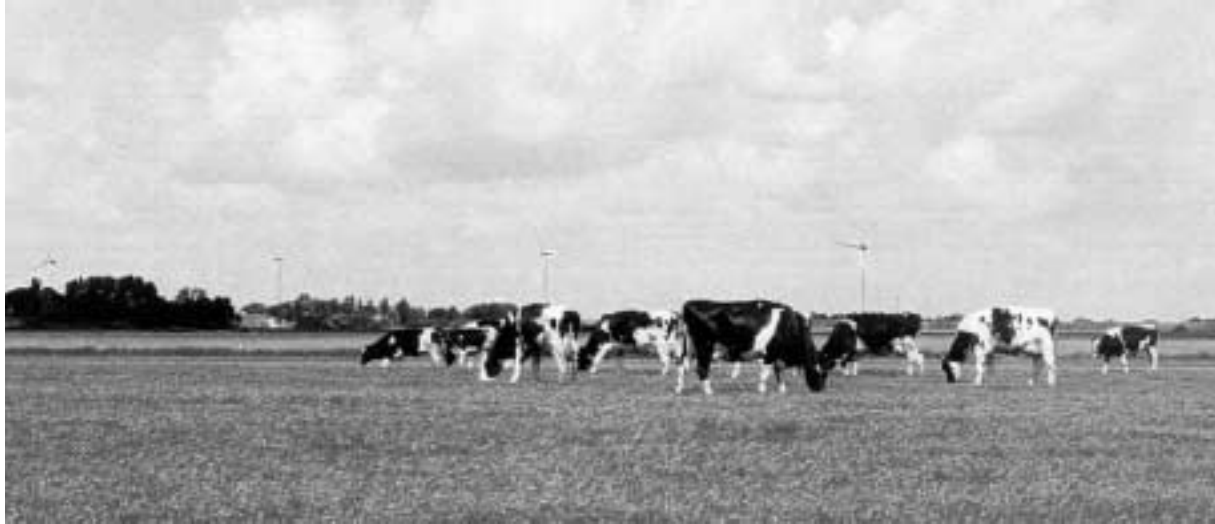
Une impression d'artiste de l'une des lignes de turbines proposées dans le plan.

Lors de la préparation du Bestemmingsplan (Plan local), la municipalité s'est appuyée sur cette étude pour proposer 8 zones de développement éolien. S'inspirant des lignes géométriques des polders, la municipalité a proposé de limiter les nouvelles installations à de grandes éoliennes de forte puissance implantées par série de cinq lignes le long de canaux de drainage, et en petit groupe sur trois sites.