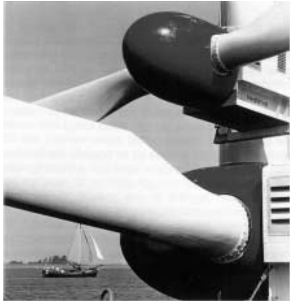
Assemblage d'une éolienne offshore.

Actuellement, un projet vise à l'installation d'un parc éolien de 300 MW dans la IJsselmeer, en eau profonde près de Afsluitsdijk. Ce projet est considéré comme un projet onshore puisqu'il est sensé se trouver à l'intérieur des frontières. Cette proposition fait actuellement l'objet d'une évaluation environnementale, et sera sans nul doute un test déterminant pour l'avenir de l'éolien au Pays-Bas.