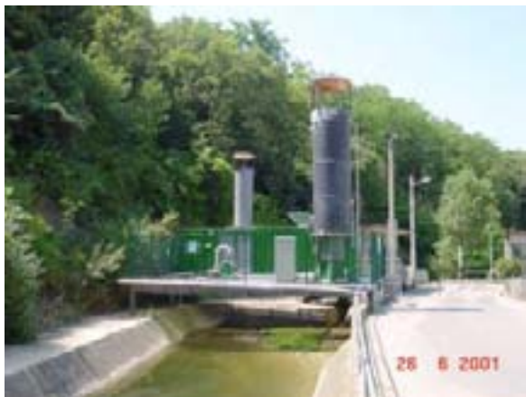
Rysunek 1. Wysypisko odpadów w St Alban les Vignes

SYVROM powierzył Rhonalpennergie-Environnement Agency wykonanie studium. Praca została rozpoczęta w 1995 roku. Powołaniem Agencji jest wspomaganie władz terenowych w regionie Rhône-Alpes w badaniu rozwiązań i usprawnianiu projektów promujących zastosowanie energii odnawialnych oraz pomoc w kontaktach z właścicielami instalacji.