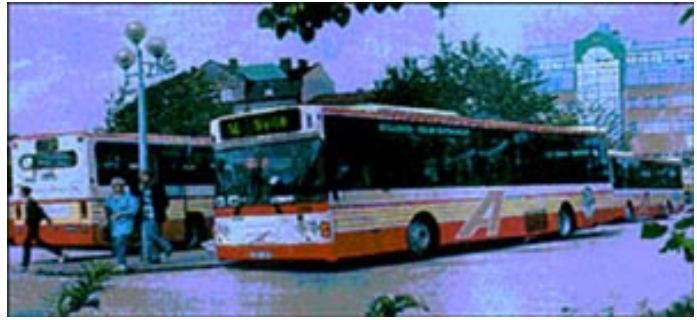
EIN IN TROLLHÄTTAN EINGESETZTER BIOGAS-BUS