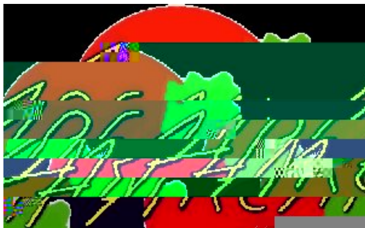
AREAM - AGÊNCIA REGIONAL DA ENERGIA E AMBIENTE DA REGIÃO AUTÓNOMA DA MADEIRA

La sezione Catering di questo pacchetto mostra le opportunità del risparmio energetico nelle cucine e comprende i seguenti argomenti: conservazione degli alimenti, cucina, assorbimento dell'aria, lavaggio delle stoviglie, riscaldamento, illuminazione, manutenzione e lavanderia. Un'altra sezione del software copre l'efficienza energetica nelle aree di intrattenimento, in particolare nelle piscine.