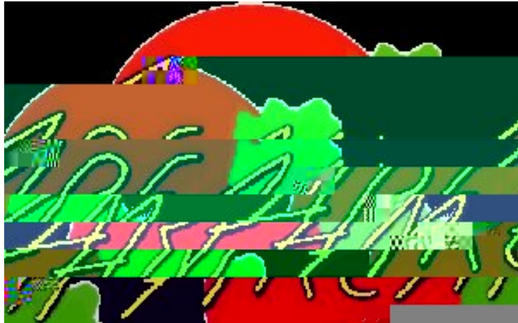
AREAM - AGÊNCIA REGIONAL DA ENERGIA E AMBIENTE DA REGIÃO AUTÓNOMA DA MADEIRA

Andere Bereiche der Software betreffen die Energieeffizienz bei Freizeiteinrichtungen, vor allem bei Swimmingpools.