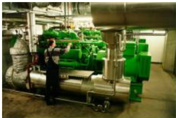
KWK-ANLAGE DES BOTANISCHEN GARTENS

Mit dem Jahr 2002 existierten 70 dezentrale KWK-Anlagen mit einer kumulierten elektrischen Leistung von 24.000 kW. Die Motoren, meist für den Brennstoff Erdgas ausgeführt, decken ein Leistungsspektrum von 5 kW bis 4000 kW ab. Kleinere und mittlere KWK-Anlagen werden in städtischen Gebäuden, Kindergärten, Altersheimen sowie in der Industrie und in einigen Nahwärmenetzen betrieben. In Bürogebäuden und Krankenhäusern werden KWK-Anlagen oft in Kombination mit Absorptionskältemaschinen eingesetzt (Trigeneration). Eine KWK-Anlage mit einer elektrischen Leistung von 50 kW in einem Altersheim ist mit einem Kondensationswärmetauscher ausgestattet. Eine in einem botanischen Garten eingesetzte 800 kW-Anlage läuft kombiniert mit einer neu entwickelten "Hochtemperatur-Kondensationsanlage". Diese fährt einen Absorptionsprozess, mit dem der Gesamtwirkungsgrad auf mehr als 95% gesteigert werden kann. Im Rahmen eines Praxistests betreibt das Energieversorgungsunternehmen MAINOVA einen 4-9 kW Stirling-Motor. Weiters ist noch ein Brennstoffzellensystem (200 kW) von ONSI und eine 100 kWel Mikro-Gasturbine in zwei Schwimmbädern im Einsatz.